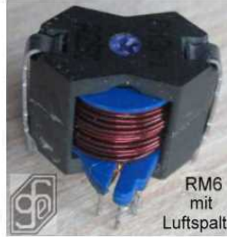
RM6 mit Luftspalt