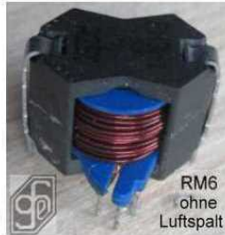
RM6 ohne Luftspalt